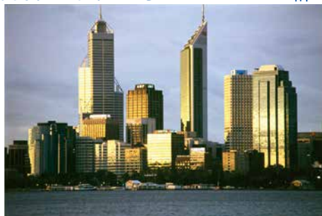
'State Library of WA<BA1611/1560> Perth skyline from South Perth at sunset, 1998