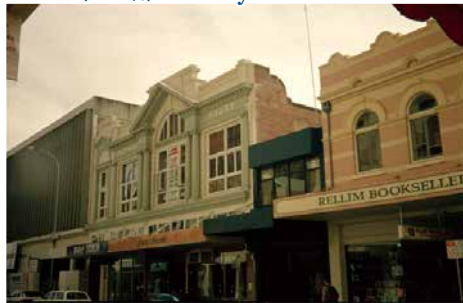
'State Library of WA<BA1693/49> Durham House and Rellim Booksellers, Hay Street, Perth

パース中心部の Hey Street にある His Majesty's Theatre 向かいの街並