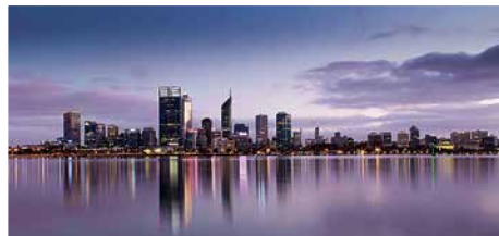
Perth City Skyline at dawn