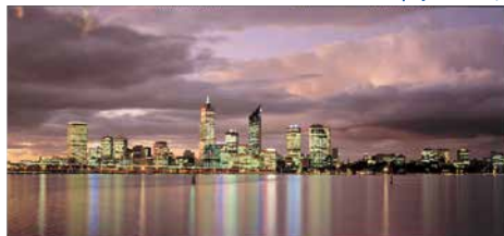
'State Library of WA<BA1611/1458> Perth skyline from South Perth at sunset, 1998