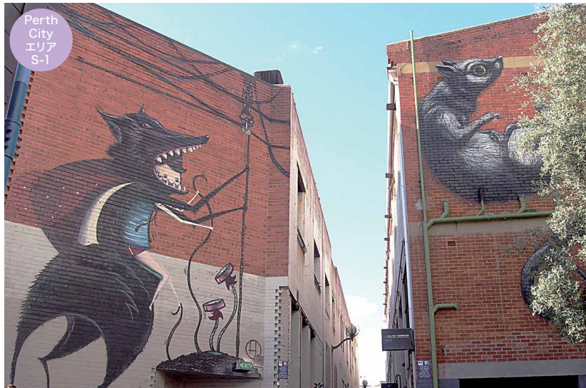
☛ WOLF LANE は、狼以外の壁画も集っている路地です。