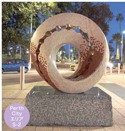
☛ Elizabeth Quay 駅で行き交う人々を見つめています。