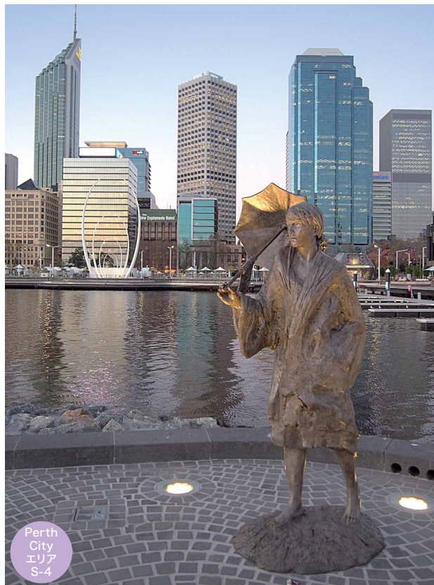
☛ 2016年に完成したパースの新名所、Elizabeth Quayで高層ビル群を背に立っています。