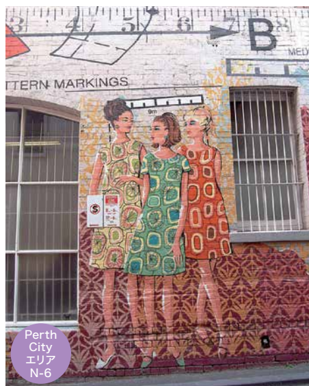
Perth City エリア N-6