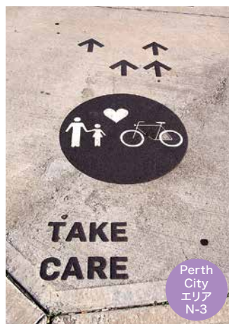
Perth City エリア N-3