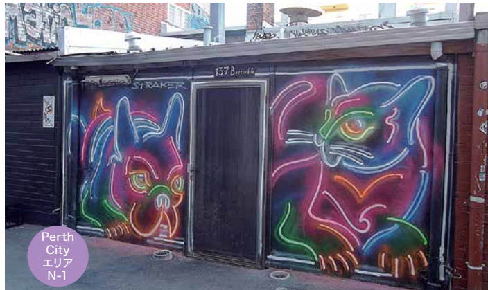
Perth City エリア N-1

Perth City エリアの N-1 ~ N-6 は、このマップ内にあります。ヒントの中のキーワードもマップ内に記されているので、見つけて出して参考にしましょう。