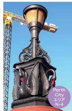
Perth City エリア N-4

Ⓛ Perth 駅付近の WELLINGTON ST 沿いを歩く時、斜め上を見上げてみると、その姿を発見できます。