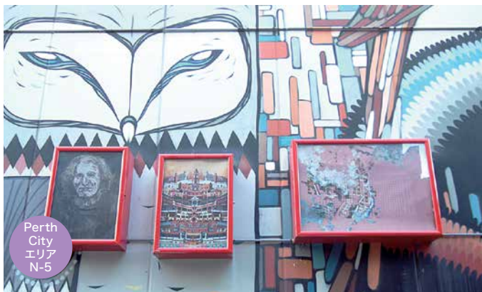
Perth City エリア N-5

Ⓛ Perth 駅付近の WELLINGTON ST 沿いを歩く時、斜め上を見上げてみると、その姿を発見できます。