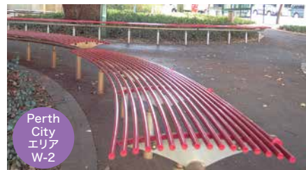
Perth City エリア W-2

📍 Florence Hummerston Reserve にあるのは、木を主役にした真っ赤なベンチ。