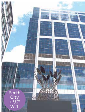
Perth City エリア W-1

Perth City エリアの W-1 ~ W-5 は、このマップ内にあります。ヒントの中のキーワードもマップ内に記されているので、見つけて参考にしましょう。