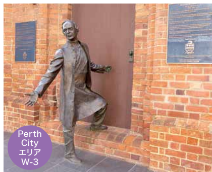
Perth City エリア W-3

📍 Florence Hummerston Reserve にあるのは、木を主役にした真っ赤なベンチ。