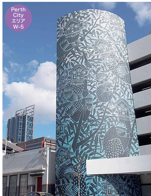
Perth City エリア W-5

📍 MURRAY ST にある駐車場からも見える巨大な姿。その駐車場にもたくさんの壁画が描かれています。