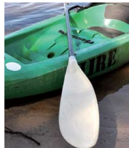
1人乗り用のシングルカヤックとパドル。

お店にはシングルカヤック（1人用）とダブルカヤック（2人用）の2種類があり、パドルやライフジャケットも貸してくれます。