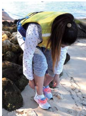
靴を脱ぎ、スワン川に入る準備開始。カヤック上は裸足でOK。