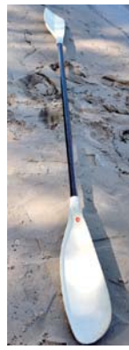
両側にヘラのついたカヤック用のパドル。

お店にはシングルカヤック（1人用）とダブルカヤック（2人用）の2種類があり、パドルやライフジャケットも貸してくれます。