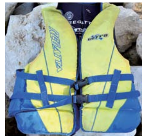
水上でのアクティビティでは、万が一に備え、ライフジャケットの着用を推進。