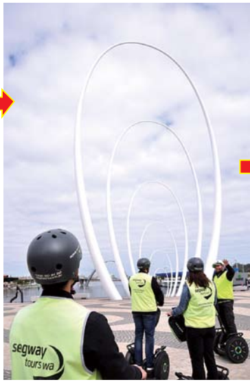
パースの新しいランドマーク、Elizabeth Quayもセグウェイで走り抜けれます。