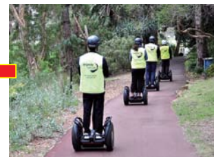
公園内の細い小道やカーブも、セグウェイに乗ってスイスイ移動。