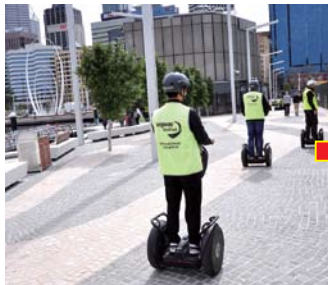
ツアーの参加者全員がセグウェイの操作を憶えたら、パースの街中へ繰り出します!

操作をマスターしたら、いよいよ街へ出発!ガイドの案内を聞きながらセグウェイツアーを读者モデルのチャンさんに参加していただきました。