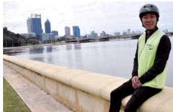
セグウェイを下りてひと休み。