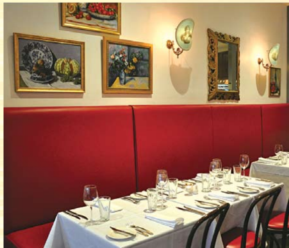
“フランスにあるビストロ”がコンセプトの店内では、パースにしながらフランスの雰囲気を味わえます。耳を澄ませば、フランス語が聞こえてくるかもしれません。

足を踏み入れたら、そこはフランスの街角にある昔ながらのフレンチ・ビストロ。まるでフランスを訪れているかのような気分になりながら、こだわりのフランス産ワインやチーズと、西豪州産の新鮮な食材で作られる伝統的なフランス料理を味わってみませんか。