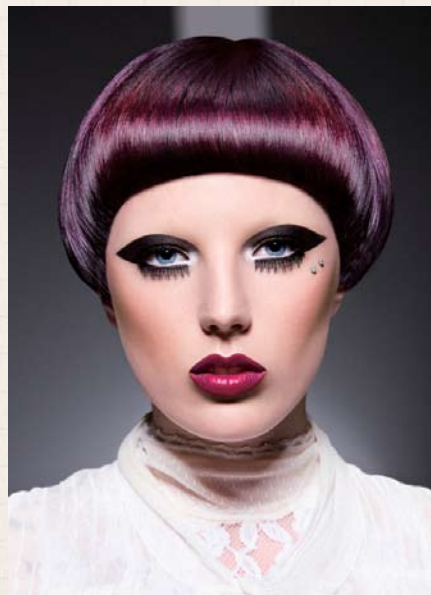
Photo by Chris Huzzard, Model by Natalie Hind, Photo courtesy of Pierrots Hair Salon.