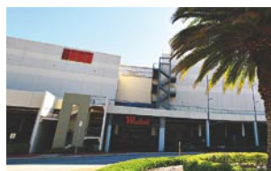
多彩なラインナップの映画が公開されている映画館。

休日：アンザック・デー、グッド・フライデー、クリスマス・デー。 アクセス：パース市街地より約15km。Albany Hwy 沿い。