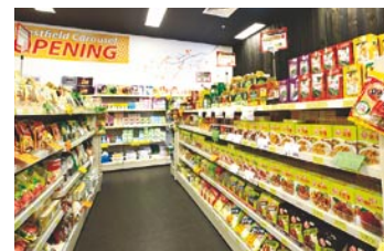
バラエティ豊かな食品を提供しているアジア食品店。