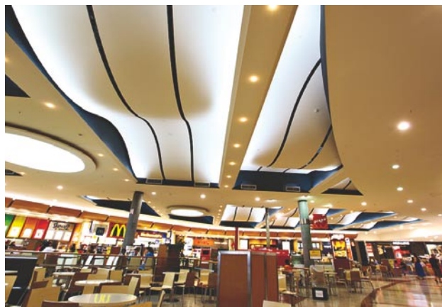
世界の国の料理が手軽に楽しめる飲食店エリア。

再開発以来、現時点では西オーストラリア州で最大級の売り場面積を誇るショッピングセンター。ここは、センターを取り囲むように道路が整備され、出入口も多く、四方から駐車場に入ることができる。また専用道路も整備され、アクセスには入念な配慮がなされている。Liege Stを挟んだ先には、西オーストラリア州で最も歴史あるドッグレース場（Greyhounds WA Cannington）があり、現在もレースが盛んに行なわれている。