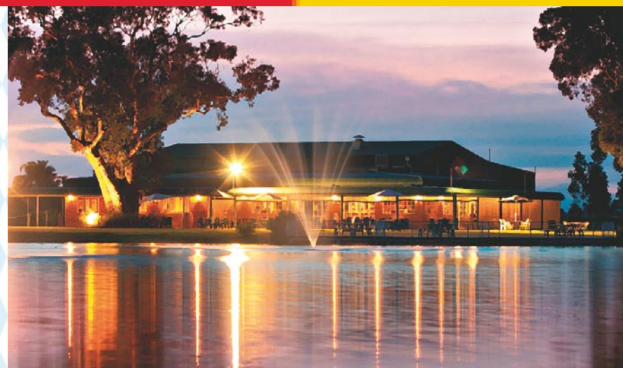
Welcome to the Valley

スワンバレーにある2つの会場をツアー形式で巡るオクトーバーフェストにちなんだお祭りで、ドイツ風に作られたビアホールで冷たいビールとランチを愉しみ、夜はミュージック・フェスティバルで盛り上がる！