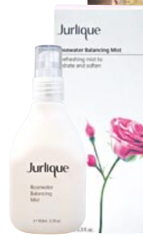
Jurlique Rosewater Balancing Mist (バラシソウ・ミスト)