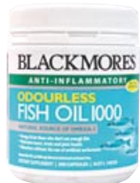
Blackmores Odourless Fish Oil 1000 (健康維持を促す栄養剤)