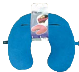
首凝り解消の首枕