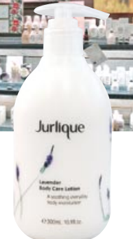
Jurlique Lavender Body Care Lotion (ボディケア・ローション)