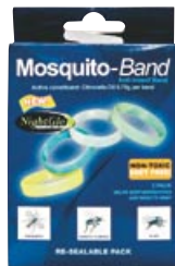
Mosquito-Band Anti-Insect Band (虫除けバンド)