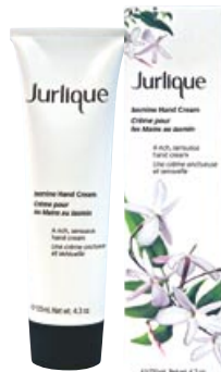
Jurlique Jasmine Hand Cream (ハンドクリーム)

お土産にもお勧め。日本でも人気のオーストラリア産自然化粧品のジュリクも取り扱っています。