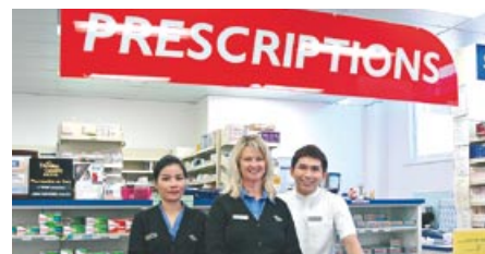
「PRESCRIPTIONS」で処方箋医薬品を受け取ります。

お土産にもお勧め。日本でも人気のオーストラリア産自然化粧品のジュリクも取り扱っています。