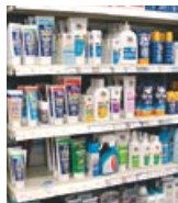
Marine Blue Australia SPF 30+ Every Day (日焼け止めスプレー)