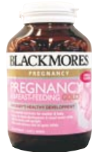
Blackmores Pregnancy & Breast-Feeding Gold (妊婦や胎児への栄養補助剤)