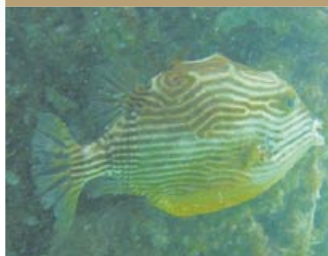
体長 約 25cm