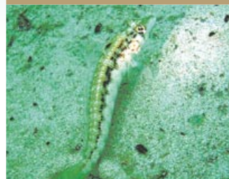
体長 約 11cm