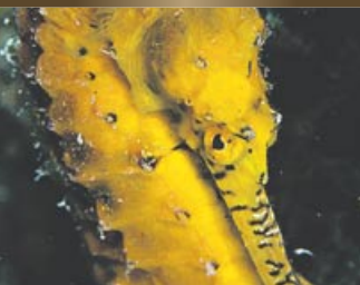
体長 約 22cm