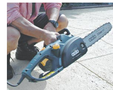
前のものが壊れたので、2台目となるチェーンソー

「材料はフリーマーケットで購入。周囲の家を観察して、タイルを貼る時に、上下をずらすことに気付きました。」