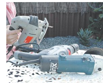
頻繁に使用する電動工具の一部