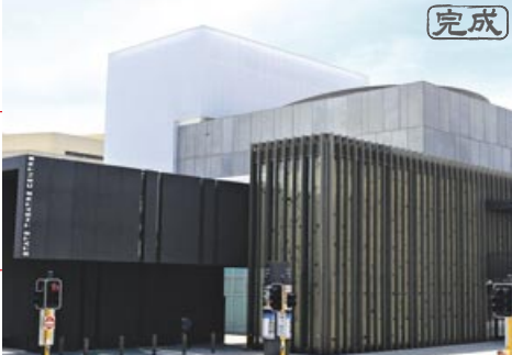
様々な現代舞台芸術が披露されている州立劇場

『パース・カルチャー・センター』は、市民が芸術や文化、知識などを共有することを目的として設けられたエリア。2011年における進展としては、まず州立劇場が1月に完成。同年10月には、情報の共有や芸術活動の場となる大型LEDスクリーン（州立図書館前）、子どもたちの感性を育てることを目的としたプレイ・スペース（州立博物館前）が完成した。また、州立美術館前に設けられた果樹園では、持続可能な園芸についても学習することができる。現在も同エリア内にて様々な計画が進行中。