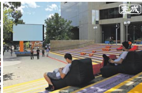
映画などが上映される大型LEDスクリーン（写真左奥）