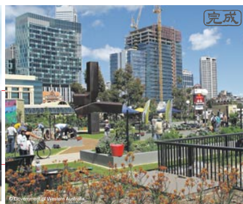
都会の真ん中にある果樹園