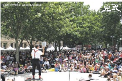
大道芸人がパフォーマンスを披露するセンターの広場