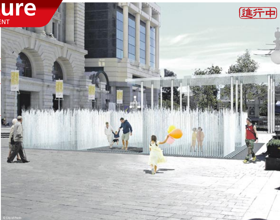
建設進行中の水を用いたアトラクションの完成予想イメージ

フォレスト・プレイスの再開発の一端として、現在、新たに水を用いたアトラクションが建設中。水のジェットが発射され、四方を水の壁で囲まれた“部屋”のようにするこのアトラクションは、デンマーク人アーティストの Jeppe Hein 氏によってデザインされた。設置予定の周辺エリアは、すでに様々なイベントなどに利用されているが、このアトラクションの完成により、さらに多くの人々が集まり、エリア全体の活性化が期待される。