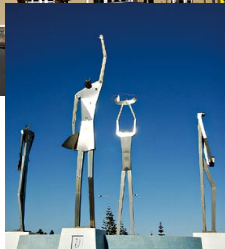
ユニークな彫像を発見。“The Navigators”と呼ばれる4体の像は、東西南北それぞれの方角を向き、魚やサーフボードなど、バンバリーの魅力を象徴するものを持つ。夜間は幻想的にライトアップされる。

WA州南西部の玄関口に位置する同州第3の都市、バンバリー。街には街路樹や公園で緑が溢れ、のんびりとした雰囲気にも包まれている。個性豊かなお店が軒を連ね、『カプチーノ通り』と呼ばれるビクトリア・ストリート (Victoria Street) では、カフェで旅先の空気を楽しみながらリラックスできる。街にはユニークな彫刻作品が点在しているので、散策をしながら観賞したい。日頃の疲れを忘れて、肩の力を抜いて歩ける街、そんなバンバリーの魅力に触れたい。