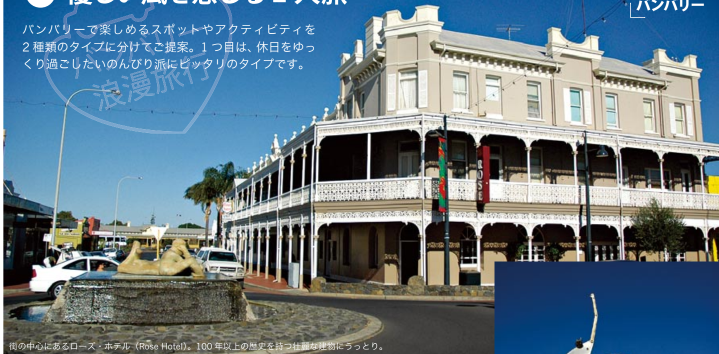
街の中心にあるローズ・ホテル (Rose Hotel)。100年以上の歴史を持つ壮麗な建物にうっとり。