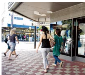
ウィンドウ・ショッピングをする2人。かわいい雑貨屋さんを見つけては、立ち止まってチェック。