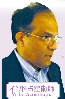
インド占星術師 VEDIC ASTROLOGER