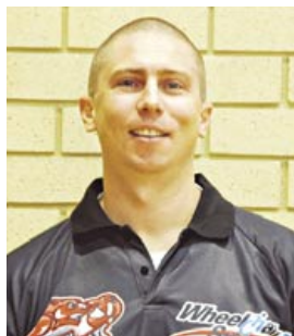
監督 Ben Ettridge ベン・エトリッジ

バスケットボールに対する情熱と独自の知識で、2004年のリーグからパース・ウィルキャッツの監督に就任。昨シーズン、チームを2度目の優勝に導いた(自身にとっては初)。昨年はイタリアのプロリーグのチームでも指揮を執った経験を持ち、今年3月からは豪州代表の監督として、国内中から北京パラリンピックでの好成績が期待されている。