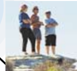
道路から外れた崖の上からは、広大な海が眺められる。足場に注意しよう。