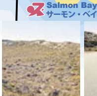
内陸側の丘陵に沿ってきれいに生え揃う植物。