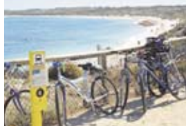
波が穏やかなサーモン・ベイのビーチ。岩礁が広がり、海中ではたくさん生物を見ることができる。