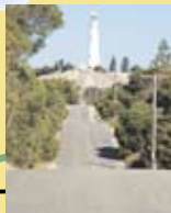
灯台までのこの道のりは、アップダウンが激しい。