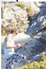
岩場で釣りを楽しむ。