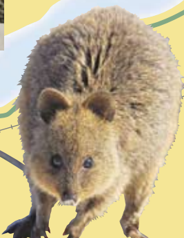
道端でクウォッカと嬉しい対面をすることも。