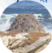
岩の上にある立派なミサゴの巣は、80年以上前からあるとされているから驚き。