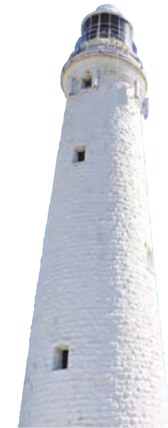
ワジェマップ灯台。ロットネスト島はアボリジニの言語で「水を越えた場所(ワジェマップ)」と呼ばれている。現在の灯台は1896年に完成。