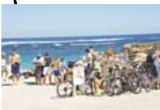
リトル・サーモン・ベイは多くの人が集まる人気のスイミング・スポット。