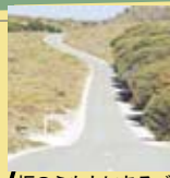
坂のふもとにあるバス停は、ボーボイズ・ベイの入り口になっている。