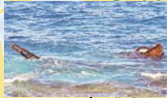
ヘンリエッタ・ロックス付近では4つの船が難破したと言われ、その内の1つが海面に見えている。