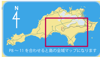
P8~11を合わせると島の全域マップになります