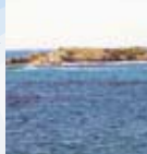
アシカが生息しているというダイアー島が見える。